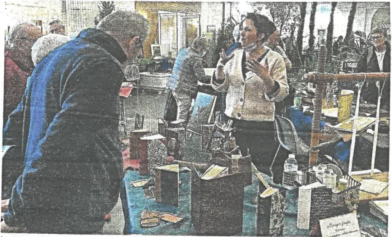
Les artisans d'art partagent leur passion avec un public très curieux et demandeur d'explications. J. D.